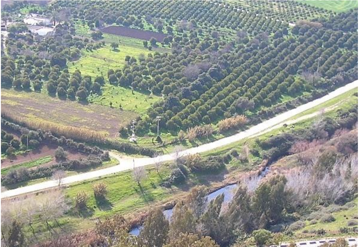
これは南西方の眺望。この山の周辺の平野部は殆どがオリーブ畑と牧草地です。