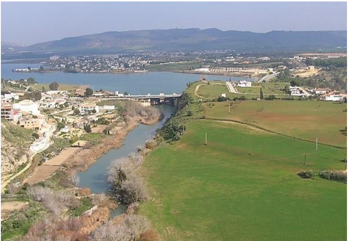
別の展望台から北東方を。この湖水は夏の渇水期には貴重な水瓶になるのでしょう。